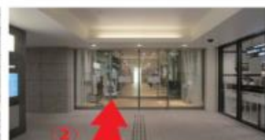
(地下1階からエレベーターホール側を写した写真)