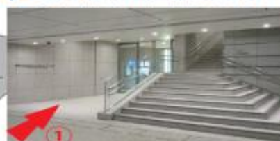
(三越前駅方面から千葉銀行側入り口を写した写真)